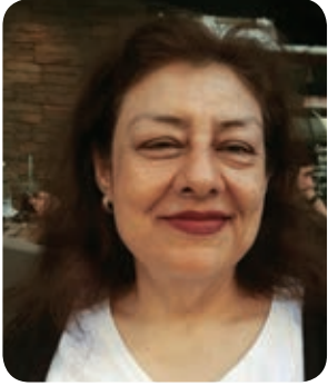
Av. Mualla ÖZMEN