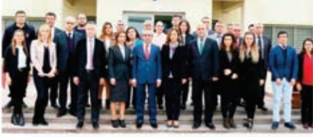
Şakran Çocuk ve Gençlik Kapalı Ceza Infaz Kurumunu ziyaret eden İzmir Barosu Çocuk Hakları Merkezi üyeleri avukatlar, çalışanları inceledi.