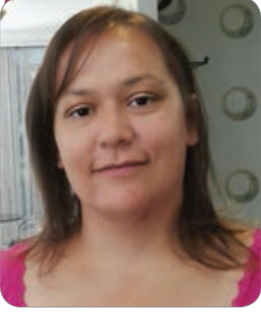
Av. Ece ÜSTÜNDAĞ