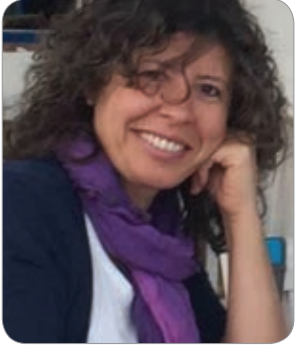
Av. Şefika MISIRLI