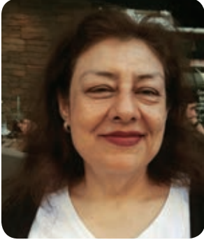
Av. Mualla ÖZMEN