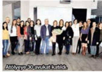
Atölyeye 30 avukat katıldı.