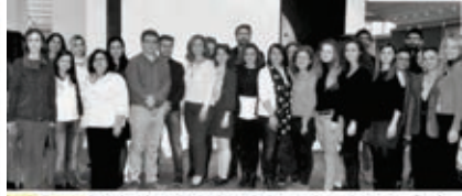
Izmir Barosu 'nda katılımcıların deneyim ve paylaşımlarının ışığında tartışmaların da yapıldığı toplu atölye çalışmasına 35 avukat katıldı.

Izmir Barosu Çocuk Hakları Merkezi tarafından, Çocuk Hakları alanında çalışma yapacak olan avukatlara yönelik olarak "Uygulamada Çocuk Hakları" başlıklı bir atölye çalışması gerçekleştirildi.