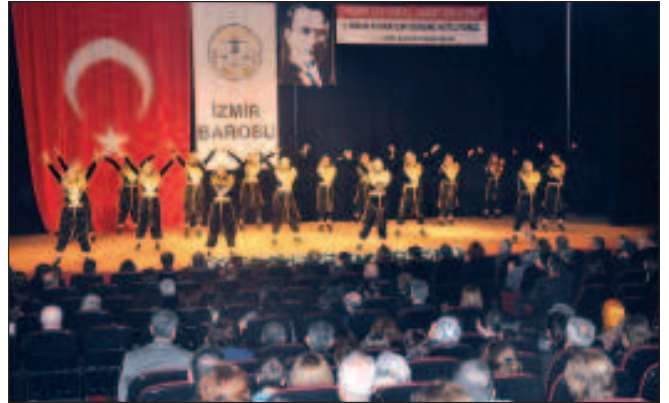
İzmir Barosu Türk Halk Oyunları Topluluğu gösterisi