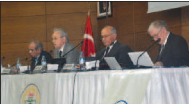
Birinci gün birinci oturum konuşmacıları