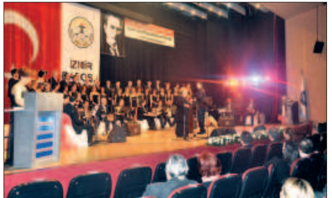
İzmir Barosu Türk Sanat Müziği Korosu Konseri

Takip eden 7 Nisan akşamında ise yine EÜ Atatürk Kültür Merkezinde İzmir Barosu Sanat Müziği konseri yapıldı. Koro üyeleri arasında avukatların yanı sıra adliye mensuplarının da bulunması her zaman olduğu gibi bizleri sevindirdi.