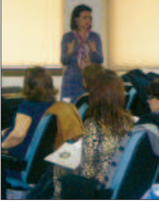
Av. Aytül Arıkan