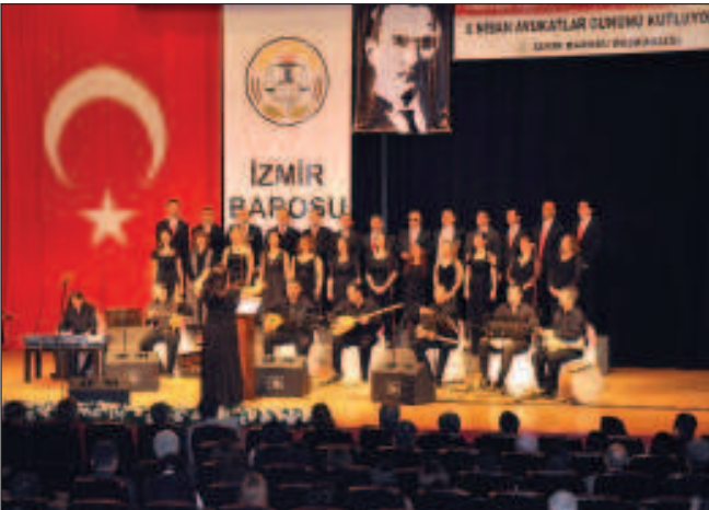
İzmir Barosu Türk Halk Müziği Korosu Konseri

Yine 6 Nisan akşamı, İzmir Barosu Türk Halk Müziği Korosunun konseri, her yıl olduğu gibi bu yılda sizlerin ilgisine mazhar olarak EÜ Atatürk Kültür Merkezinde yapıldı.