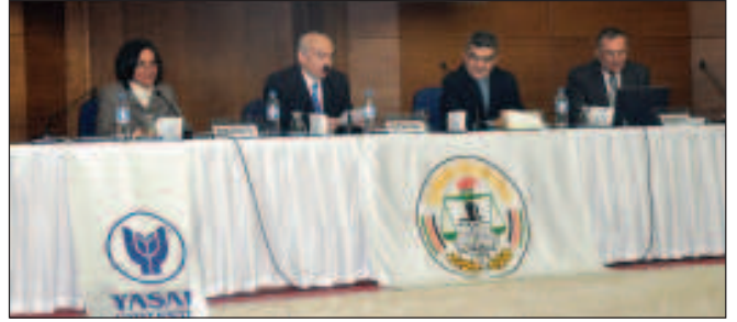
Birinci gün ikinci oturum konuşmacıları