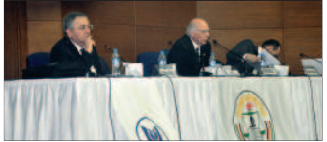
İkinci gün Birinci oturum konuşmacıları