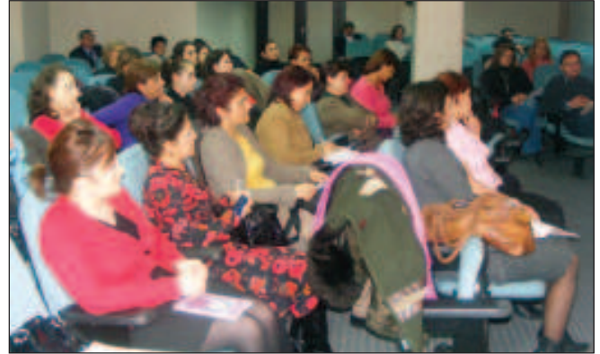
Salondan bir görüntü