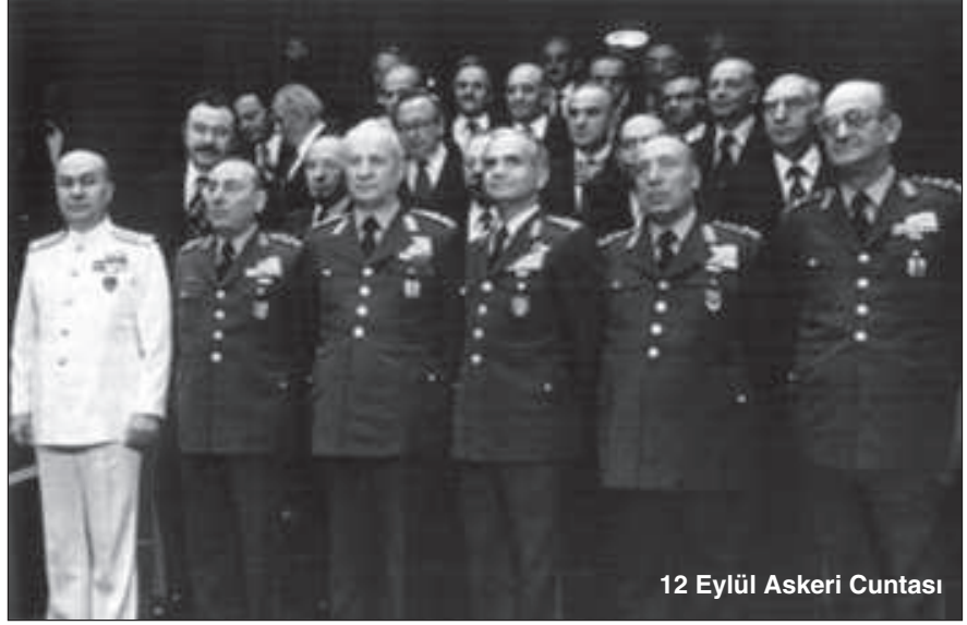
12 Eylül Askeri Cuntası

Askeri gözetim evi, emniyete göre gerçekten cennet gibi, ama oranın da sorunu, tuvalet sorunu. Emniyetten geldikten sonra ilk defa büyük tuvaletimi askeri gözetiminde yapabildim. Günlerdir tuvalete çıkamadığım için kabız olmuşum. Müshil ilacı alarak rahatlayabildim. Koğuştaki tek tuvalet ve 70-80 kadar insan var. Tuvalete gireceksin, kuyrukta bekliyorsun. Hadi tuvalete girdin, birkaç dakika sonra dışarıdakiler "hadi çık artık" diye söylenmeye başlıyorlar. Zaten