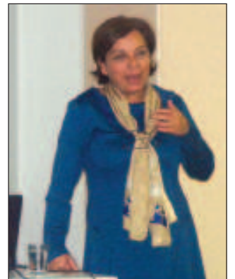
Av. Pelin Erda