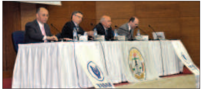
Birinci gün ikinci oturum konuşmacıları