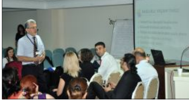
Prof. Dr. Erdal Beşer

1999 yılında yoğun çalışmalar ve toplantıların ardından 2000 yılında faaliyete başlayan SEM, o günden bu yana çalışmalarını aynı tempoda sürdürüyor. 2000 yılında SEM'in faaliyete başlamasını sağlayan 1998-2000 dönemi