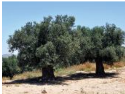
Yokolma tehditi altındaki zeytinlikler...

28. İzmir'de giderek artan bir şekilde yaşanan hava kirliliği, denetimsizlik nede-