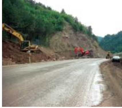
Otoyollara feda edilen ormanlar...

24. İnşaat, turizm ve madencilik lobisinin Meclis ve Bakanlıklarda yürüttüğü aktif girişimler sonucunda çıkarılan yasa/yö-