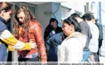
İzmir Barosu'ndan 'El Ele Adalet Zinciri'

İstanbul Kadıköy'den sonra İzmir'de Konak ve Çiğli için 'ola- bilecek bir karar alındığı ortaya çıktı. İzmir Barosu karara