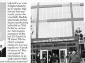
İzmir'de kürtaj uygulanan tek kamu hastanesi olan Tepecik Eğitim ve Araştırma Hastanesi'nin ek binası olarak Konak Ta hizmet veren kadın doğum ünitesinde kürtaj sessiz sedasız kaldırıldı. Online kayıt sisteminde 'kürtaj butonu' kaldırınca bu konuda yapılan tüm teklif ve hizmetlerin durduruldu bildirildi